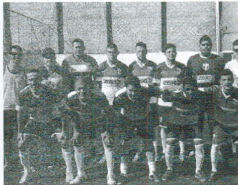
Bagueteria do Clovim