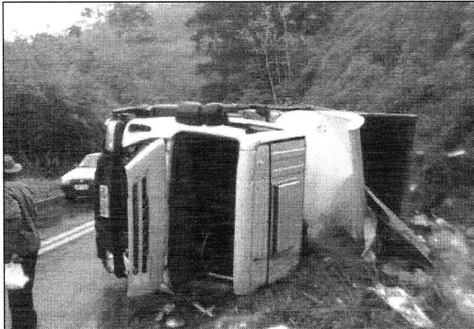
Quando iniciou uma curva à direita, perdeu o controle direcional, vindo o veículo a tomba na margem esquerda

Os ocupantes do veículo sofreram ferimentos leves. A documentação do condutor e veículo estavam em dia.