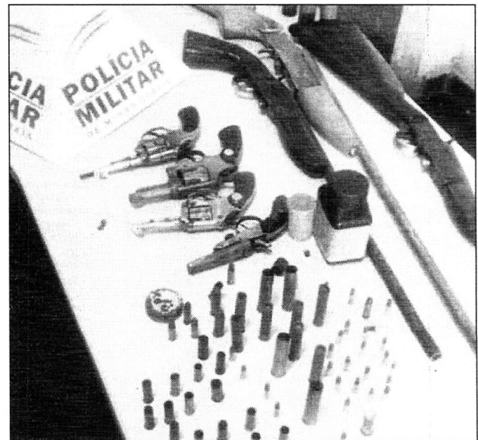
Armas e munições apreendidas em Inhapim